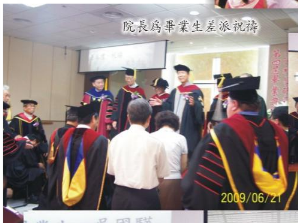
院長為畢業生差派祝禱