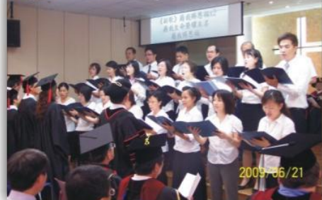
▲真道教會詩班獻詩