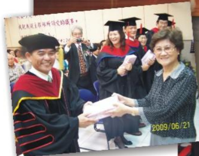
▲贈送禮物給畢業生