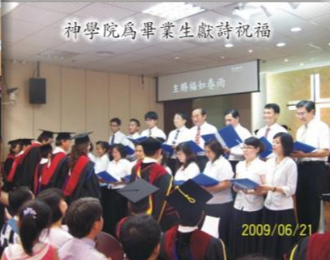
神學院為畢業生獻詩祝福